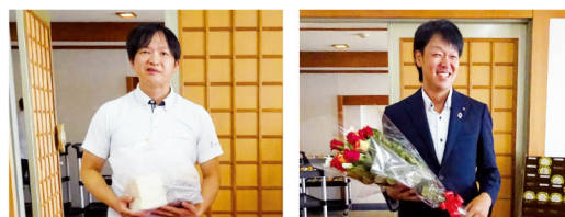
毎月恒例の、誕生日・結婚月の会員へのプレゼント。